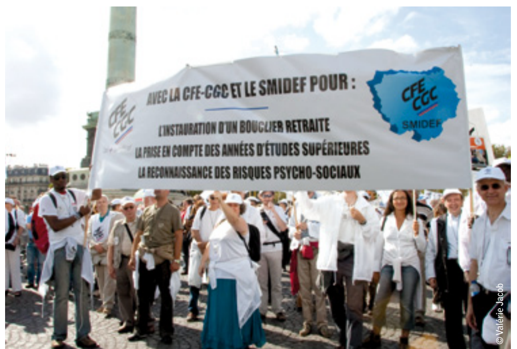
Manifestation de septembre : le SMIDEF y était.